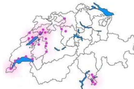
Répartition des membres du Res'effe en Suisse

Après : Les éléments émergés ont nourri la réflexion et donné l'élan pour fixer une prochaine rencontre en 2022, toujours en collaboration avec Limen et l'ARRA.