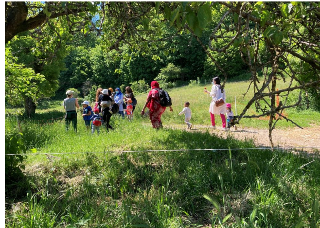
Besuch auf dem Bauernhof

entsprechend auf Familien ausgerichtet, die zusätzliche Unterstützung zu den Angeboten brauchen: Familien, die durch Krankheit oder fehlende Ressourcen Mühe haben, ihren Teil zur Förderung der Kinder beizutragen. Wir ermutigen die Eltern, ihre Kinder aktiv zu begleiten.