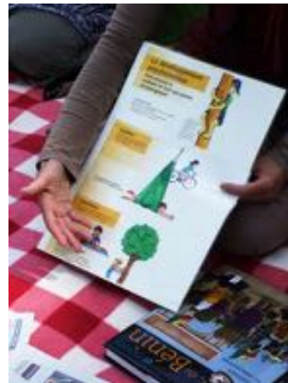
De l'importance du mouvement dans l'éducation

Nous nous réjouissons pour une année 2022 passionnante et enrichissante pour nous toutes et tous et remercions tous ceux et celles qui nous soutiennent !