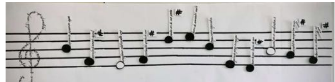
Profil de compétences symbolique : en avant la musique

Elisa Cattaruzza Friche & Léna Strasser Responsable pédagogique / Coordinatrice