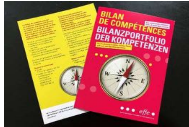
Flyer bilan de compétences

2021 fut aussi l'occasion d'accompagner le processus pour des personnes confrontées à une maladie : analyse de