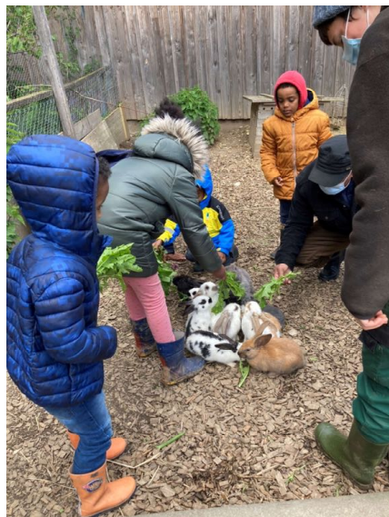
Visite à la ferme

En 2011, 10 familles ont pris part à la première volée de schritt:weise. La version en français, petits:pas, fut développée en 2012. Sabine a mis sur pied le programme à