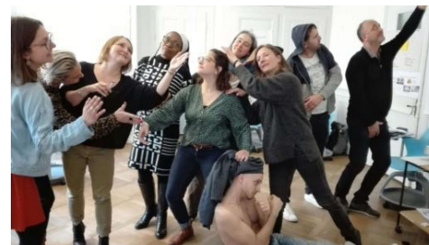
Tableau vivant en formation d'adultes

Nous avons délivré cette année 15 certificats du module 1, 9 du module 2 et 12 du module 3.