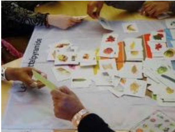
Gespräche zum Thema Ernährung

Trotz pandemiebedingt erschwelter Umstände haben 17 Moderatorinnen und 5 Moderatoren einmal mehr mit vereinten Kräften und grossem Einsatz entscheidend zum Erfolg dieser Angebote beigetragen – danke!