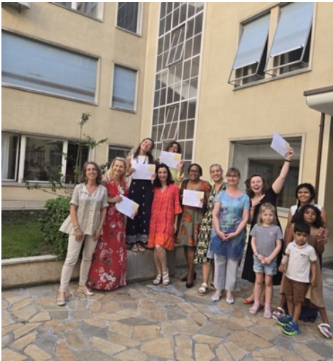
Soirée de clôture, programme Proacte , en collaboration avec l'association Découvrir , volée Lausanne 2025