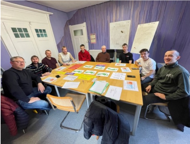
table ronde Hommes-Tische sur le thème « Choix professionnel ».

Gesprächsrunde Männer-Tische zum Thema «Berufswahl».