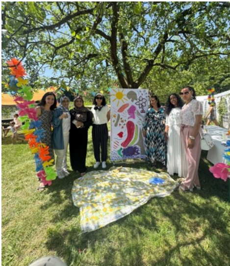
Restitution publique « Atelier de valorisation de compétences » en collaboration avec l'association RECIF, Neuchâtel