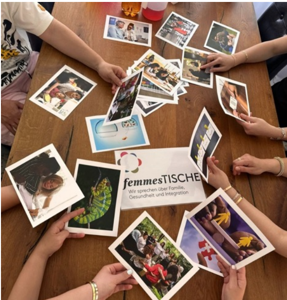
table ronde Femmes-Tische sur le thème « Ma vie ici ».

Gesprächsrunde Männer-Tische zum Thema «Berufswahl».