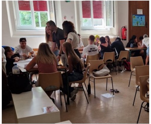
Input in La-Chaux-de-fonds, Service de la jeunesse, Mitarbeitende Tagesschule