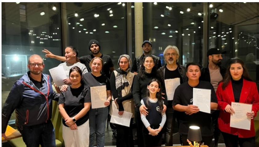
Restitution publique « Donne corps à ton projet », Théâtre du Jura, Delémont, 12 décembre 2025